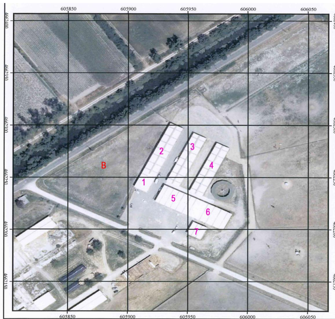
Plano Zona B