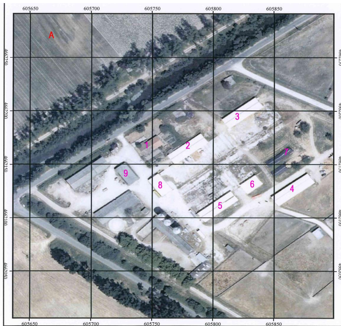
Plano Zona A